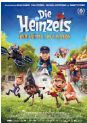
Die Heinzels - Neue Mützen, neue Mission

Untenstehend eine Auswahl der Filme an Weihnachten. Das Programm finden Sie unter www.cinema8.ch