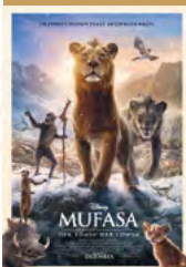
Mufasa: Der König der Löwen