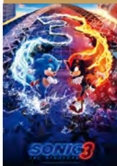
Sonic the Hedgehog 3