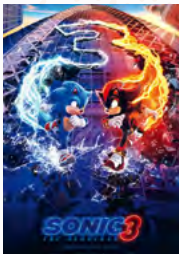
Sonic the Hedgehog 3