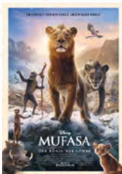
Mufasa: Der König der Löwen