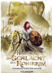
Der Herr der Ringe: Die Schlacht der Rohirrim