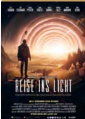
Reise ins Licht